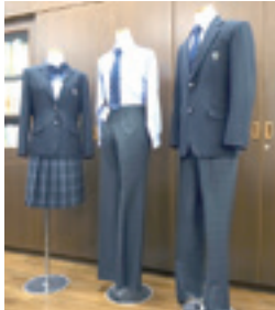
葛西中学校の新しい制服

高校生は、区長にも「中学校の制服を選択制に」と申し入れ、区長は「制服が理由で不登校になったり自殺を考えたりすることはあってはならない」と前向きに検討する姿勢を示しました。いずれも、ジェンダー平等の実現へ重要な前進です。