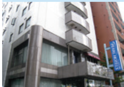
協定を結んだホテル

昨年の台風19号で課題になった要支援者の避難先について、区は福祉避難所(特養ホーム・特別支援学校など)への避難に向け、「要介護5の高齢者」と「より支援が必要な障害者」を対象に10月1日から「意向調査」を開始しました(約1,400人)。