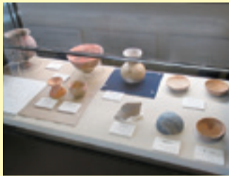
北小岩コミュニティ会館にある上小岩遺跡出土品の展示

江戸川区の貴重な歴史文化財として、今後の調査に期待するとともに、現場見学や出土品の展示など区民への還元を要望しました。